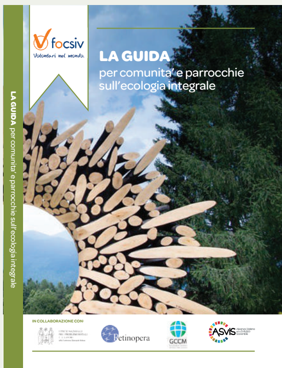
La Guida per comunità e parrocchie sull'Ecologia Integrale 2020 – FOCSIV

Per partecipare è richiesta l'iscrizione e il versamento di una quota di partecipazione di 30€ come impegno di presenza e relativo minimo sostegno ai costi del corso. Ai partecipanti oltre alle lezioni e alla interazione con i relatori verranno forniti materiali come registrazioni, slide e documenti e, su richiesta, un attestato di partecipazione. Per ogni modulo di formazione i Media Partner indicheranno ai partecipanti alcuni testi come suggerimento per l'approfondimento e Avvenire fornirà l'accesso gratuito al quotidiano on line.