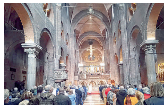
Celebrazione eucaristica presieduta dall'arcivescovo Erio Castellucci nella Cattedrale domenica 20 aprile, Pasqua di Risurrezione

attentamente troviamo dentro al male dei semi di bene. Noi siamo colpiti dalla violenza delle guerre. Forse mai come in questo tempo ne siamo colpiti dall'addensarsi dei conflitti, dall'esplosione delle bombe, spesso sugli innocenti. Vediamo dunque i tanti crocifissi, vittime delle guerre, che si impongono ai nostri occhi, sono in primo piano. E solo se guardiamo bene, in piccolo, vediamo tra tante morti, devastazioni, crimini, anche tanti segni di pace, tanti gesti di soccorso, di generosità, persino tanti eroismi quotidiani. Noi siamo colpiti dalla violenza delle malattie che distruggono tante persone e dal fatto che tanta gente non ha nemmeno la possibilità di curarsi. Vediamo i corpi che si indeboliscono, si impongono a noi. Solo se aguzziamo la vista vediamo dentro al corpo che si indebolisce anche una fitta trama di persone che si prendono cura, di affetti che diventano più intensi, di gesti di amore