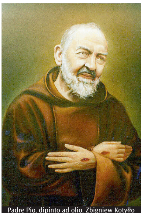
Padre Pio, dipinto ad olio, Zbigniew Kotyflo

Al mattino il ritrovo e la catechesi Poi visita guidata e Messa Previste anche Adorazione e altre attività