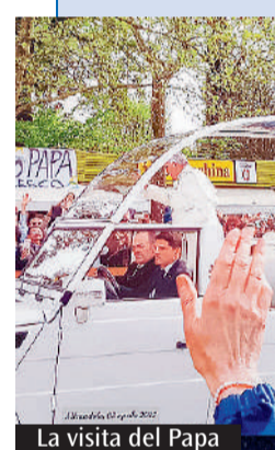
La visita del Papa