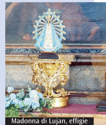
Madonna di Lujan, effigie