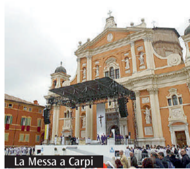
La Messa a Carpi

L'Abbazia di Nonantola, intitolata proprio a san Silvestro, custodisce anche i resti mortali di sant'Adriano III. «È significativo custodire le esequie di due Papi santi» ha concluso don Alberto sottolineando che quello dell'Abbazia di Nonantola è un «caso raro al di fuori di Roma».