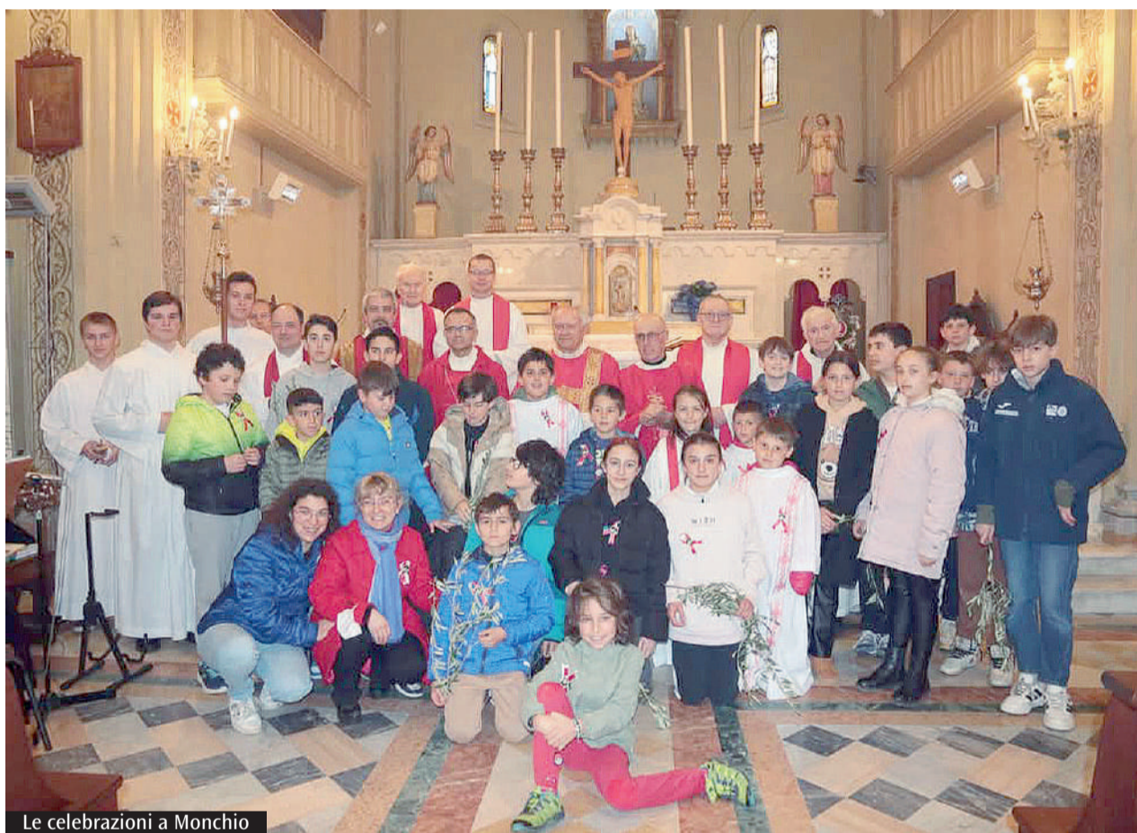
Le celebrazioni a Monchio

ci ha offerto l'opportunità di non spegnere le luci sul martirio cristiani; ieri e ancora oggi sono milioni i perseguitati, uccisi o sottoposti a violenze di ogni genere. L'obiettivo era quello di portare la riflessione dei fedeli e dell'opinione pubblica su questa immane sofferenza. Così, le catechiste e i catechisti dell'unità pastorale hanno incentrato il percorso quaresimale dei bambini e dei ragazzi su alcune figure di giovani Beati e Servi di Dio: Chiara Luce Badano, Giuseppina Bakhita, Piergiorgio Frassati, Carlo Acutis fino ad arrivare al nostro beato Rolando Rivi, per far conoscere i loro esempi di vita, di sofferenza e di mo-