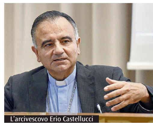
L'arcivescovo Erio Castellucci

lo diventi sempre di più. L'arcivescovo ha posto a confronto il processo a Gesù e l'esecuzione della sua condanna con le attuali tutele giurisdizionali ai diritti delle persone. «Al centro degli avvenimenti pasquali c'è un processo farsa, non c'era l'avvocato, Gesù non è stato difeso da nessuno, nemmeno da un avvocato d'ufficio - ha commentato -. Il procedimento è stato messo in piedi affrettatamente, in maniera irregolare, con una sentenza di fatto prefabbricata, semplicemente comunicata, con l'esecuzione immediata della pena senza nemmeno la possibilità di un appello. Tutto fatto di corsa, per eliminare una persona scomoda, una grande ingiustizia». «Voi testimoniate che è possibile, anzi è realtà, il contrario, la possibilità di assicurare un processo giusto, di indagare fino in fon-