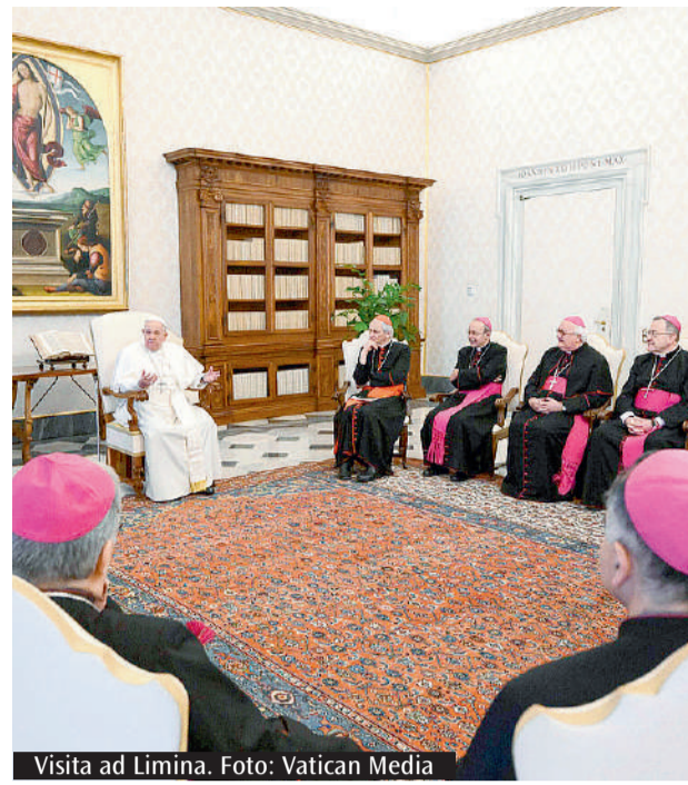
Visita ad Limina.

A nche quest'anno, in occasione del mese mariano, sarà riproposta la preghiera del Rosario in diretta televisiva, l'appuntamento realizzato grazie alla disponibilità e alla collaborazione dell'emittente TvQui (canale 17 in tutta l'Emilia-Romagna e in streaming su www.tvqui.it ). Il Rosario sarà trasmesso da giovedì 1° a venerdì 30 maggio, da lunedì a venerdì, alle 18.15. L'appuntamento si terrà nelle quattro chiese mariane che hanno ospitato l'iniziativa dal 2020: dal 1° al 2 e dal 5 al 9 maggio nella chiesa di San Giorgio; dal 12 al 16 nella chiesa parrocchiale della Beata Vergine Mediatrix (Madonnina); dal 19 al 23 nella chiesa di Sant'Agnese (eccezione fatta per il giorno 20); dal 26 al 30 al Santuario della Beata Vergine del Murazzo.