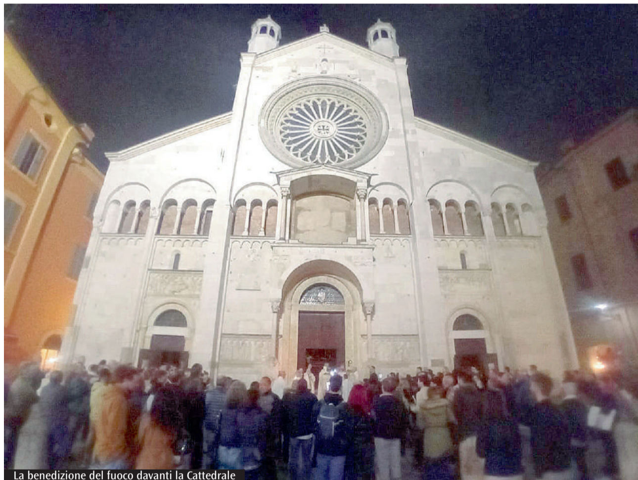
La benedizione del fuoco davanti la Cattedrale