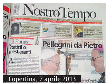
Copertina, 7 aprile 2013

Tra i ricordi della chiesa locale in Vaticano vi è l'uscita nel 2013 sotto la guida dell'allora arcivescovo Lanfranchi: «Uomo spontaneo e semplice»