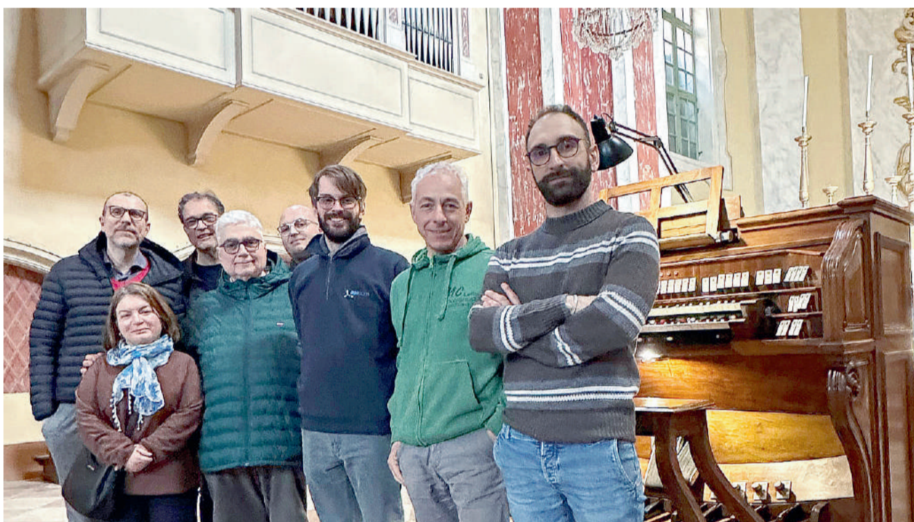
Addetti ai lavori e incaricati degli uffici diocesani Beni culturali e Ricostruzione presenti alla visita effettuata nella Chiesa di San Domenico per valutare l'esito dei lavori di restauro eseguiti dalla ditta Pietro Corna

Esso può ora adempiere alla sua doppia funzione, culturale e culturale: da un lato è in grado di accompagnare con grande dignità e decoro le liturgie della Chiesa e dall'altro può essere utilizzato in occasione di concerti. Già in seno alla prossima Festa della Musica (21 giugno), sarà possibile ascoltarlo e visitarne gli interni sotto la guida del personale dell'Associazione Johann S. Bach; nella programmazione autunnale del Modena Organ Festival sarà suonato da rinomati concertisti. Questo importante recupero, che aggiunge un ulteriore tassello al ricco patrimonio dell'arcidiocesi e del territorio, dimostra ancora una volta quanto sia fruttuoso il lavoro di squadra, grazie al quale ciascuno mette a disposizione la propria passione, la propria professionalità secondo un progetto comune e condiviso.