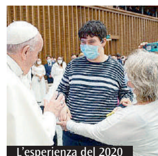
L'esperienza del 2020

puto adattarsi, restando sereni e presenti, anche in un ambiente così nuovo e stravolgente. Grazie alla sensibilità dell'organizzazione vaticana, ci fu concesso l'accesso all'area riservata alle persone con disabilità, davanti alle transenne. Da lì, abbiamo