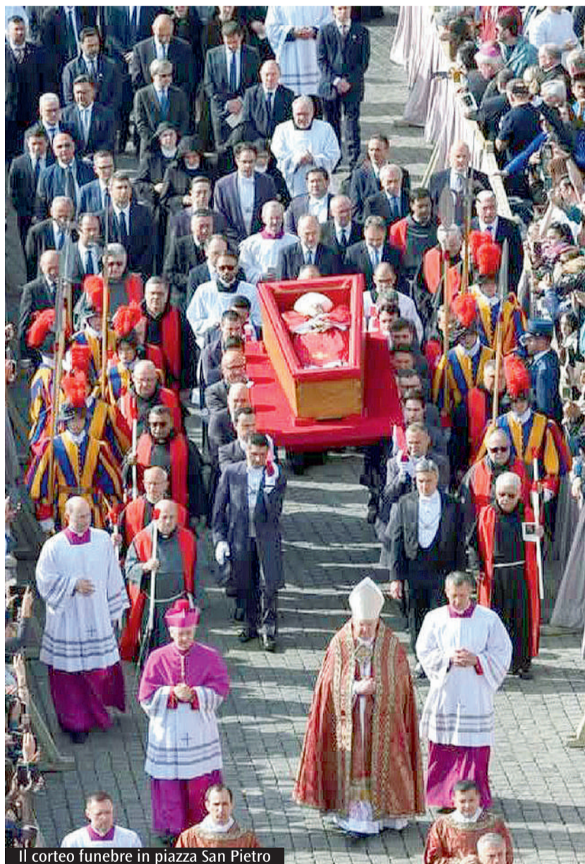
Il corteo funebre in piazza San Pietro