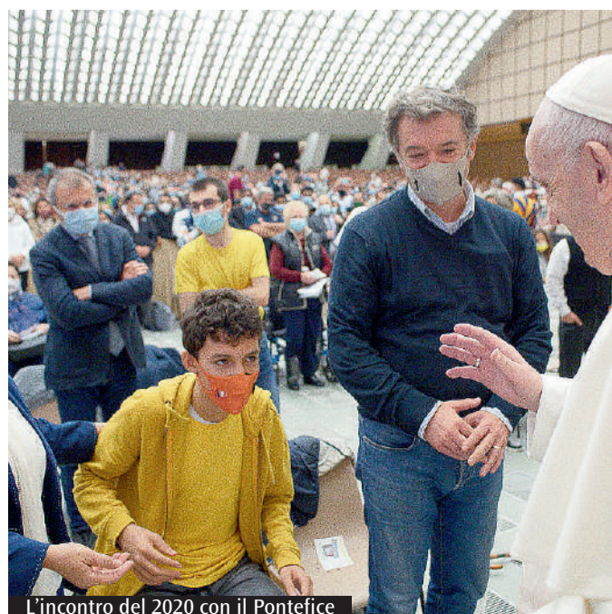
L'incontro del 2020 con il Pontefice