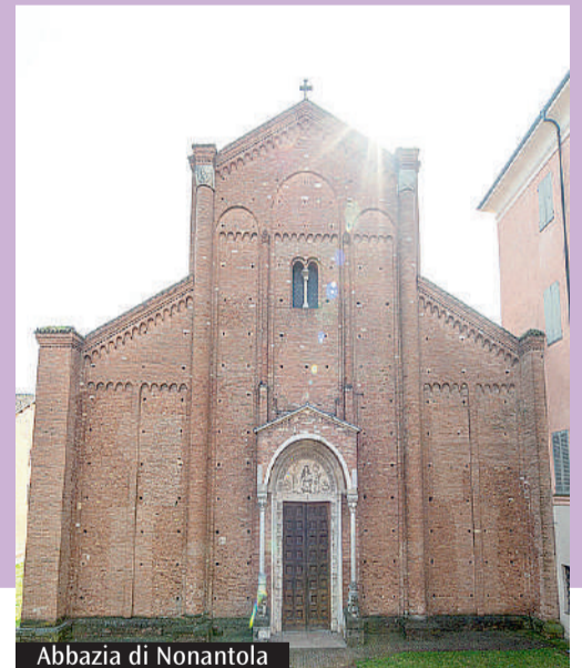
Abbazia di Nonantola