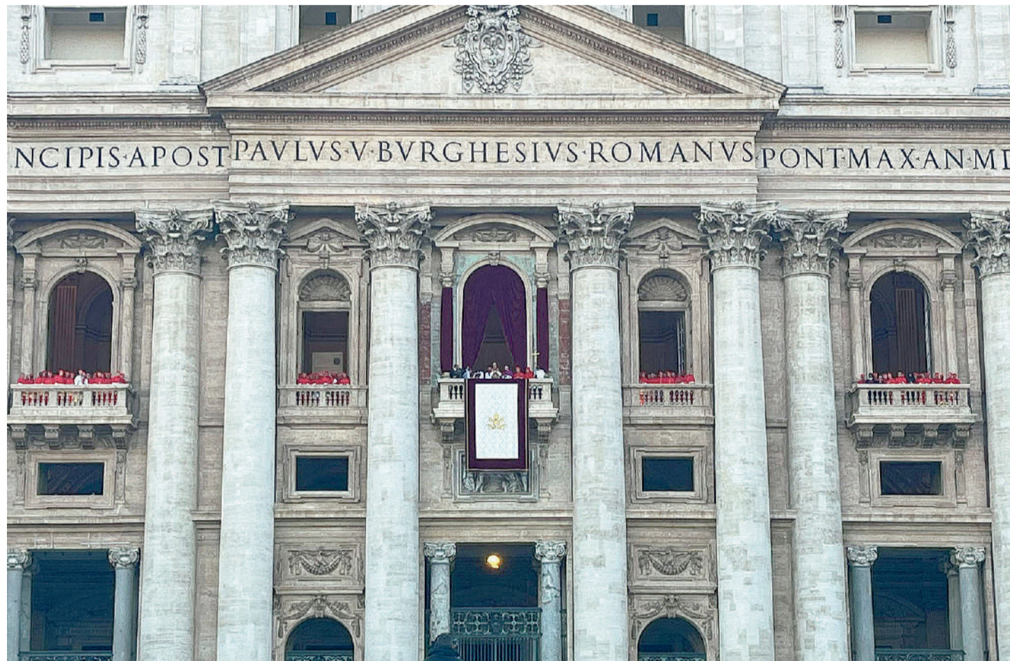
Il Santo Padre Leone XIV si affaccia dalla loggia di San Pietro dopo l'elezione giovedì 8 maggio in occasione della prima benedizione "Urbi et Orbi" alla presenza 100mila persone

«La pace sia con tutti voi!». Sono trascorsi tre giorni dall'elezione di papa Leone XIV, ma le sue parole risuonano ancora nei cuori di chi ha seguito - in presenza a Roma o da remoto - la prima benedizione Urbi et Orbi impartita dal Santo Padre giovedì 8 maggio, pochi minuti dopo la fumata bianca e l'«Habemus Papam» del cardinale protodiatcono Dominique Lambertini. L'appello tocca un nervo scoperto in un tempo in cui la pace manca da più parti. Non solo nelle zone di guerra - Gaza, Kiev, il Kashmir - bensì nel cuore di ciascuno, spesso infiammato da rabbia, rancori e disillusione. A tale proposito il Pontefice non propone la pace del mondo, ma quella «del Cristo Risorto, una pace disarmata e una pace disarmante, umile e perseverante». Leone XIV esorta anche alla Chiesa a non avere paura, a essere missionaria e a vivere secondo uno stile sinodale. Sono le venti meno un quarto circa, il sole si adagia lentamente sui sanpietrini, e il Papa impartisce l'Indulgenza plenaria. Non solo ai presenti, ma anche a coloro che seguono il momento storico attraverso i media di comunicazione. Rimarrà nella storia il frammento di discorso in spagnolo nel quale ha ricordato Chiesa di Chichilay, in Perù, da lui guidata per sedici anni, abitata da «un popolo fedele ha accompagnato il suo vescovo, ha condiviso la propria fede e ha donato