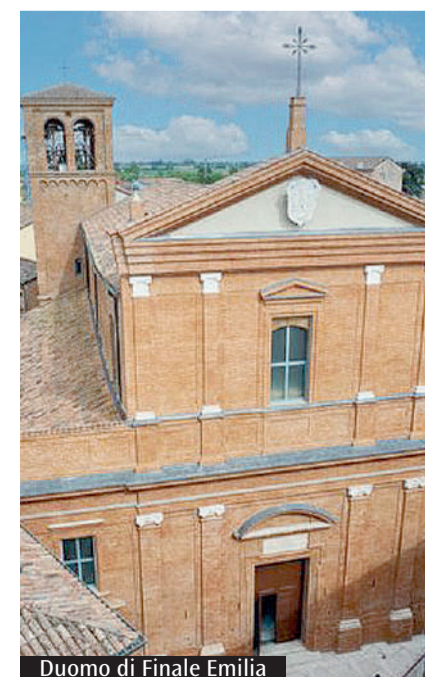
Duomo di Finale Emilia

responsabilità di «accogliere, discernere e accompagnare il cammino vocazionale delle nuove generazioni». Non manca infine l'appello ai giovani, chiamati a essere «co-protagonisti» del percorso «con lo Spirito Santo» che suscita in ciascuno «il desiderio di fare della vita un dono d'amore». «La Chiesa è viva e feconda quando genera nuove vocazioni. E il mondo cerca, spesso inconsapevolmente, testimoni di speranza, che annuncino con la loro vita che seguire Cristo è fonte di gioia - conclude il messaggio -. Non stanchiamoci dunque di chiedere al Signore nuovi operai per la sua messe, certi che Lui continua a chiamare con amore».