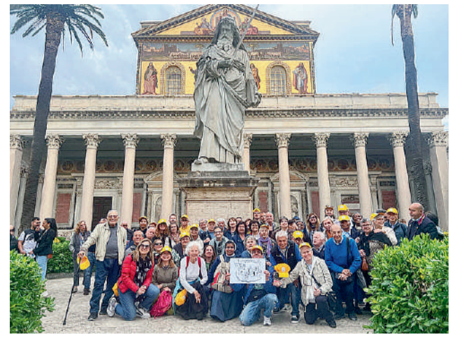
I partecipanti al Giubileo dei disabili tenutosi a Roma a fine aprile nell'ambito dell'Anno Santo 2025. Presenti anche i "Fratelli sordi di Modena e Carpi".