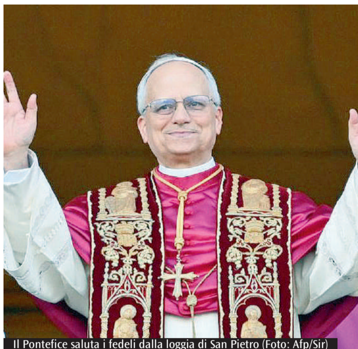
Il Pontefice saluta i fedeli dalla loggia di San Pietro