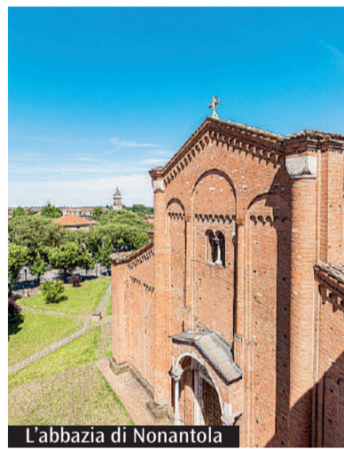
L'abbazia di Nonantola

Gli interventi nelle parrocchie finanziati dall'ente ecclesiastico fondato nel 1986 dall'attuale Banco Bpm