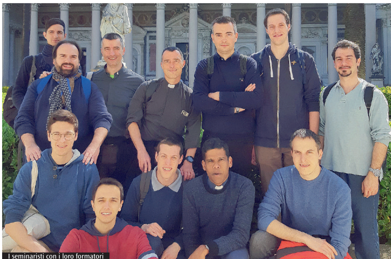
I seminaristi con i loro formatori

Oggi, nella quarta domenica di Pasqua, ricorre la Giornata del seminario per l'arcidiocesi di Modena-Nonantola e la diocesi di Carpi. Si tratta di un'occasione semplice ma importante per comprendere meglio cosa sia il seminario e pregare per questa realtà interdiocesana, che svolge un servizio prezioso per la Chiesa locale. Fin dai tempi del Concilio di Trento (XVI secolo) la Chiesa ha avvertito la necessità di creare dei luoghi idonei alla formazione dei candidati al presbiterato. Contesti in cui, a partire dalla vita fraterna, da una vita di preghiera ricca e intensa e da luoghi di formazione accademica per lo studio filosofico-teologico, i giovani potessero fare discernimento vocazionale e "attrezzarsi" alla vita presbiterale. L'intuizione fu felice e ancora oggi la realtà del seminario conserva questa missione di fondo. Tuttavia, il mutare dei contesti culturali, sociali ed ecclesiali ha richiesto un costante lavoro di revisione delle modalità pratiche attraverso cui giungere agli obiettivi di cui si è detto. Proprio in quest'ottica, durante l'autunno dell'anno scorso, è stata approvata dai vescovi italiani e dal Dicastero per il Clero la Ratio fundamentalis , contenente le nuove linee guida da se-