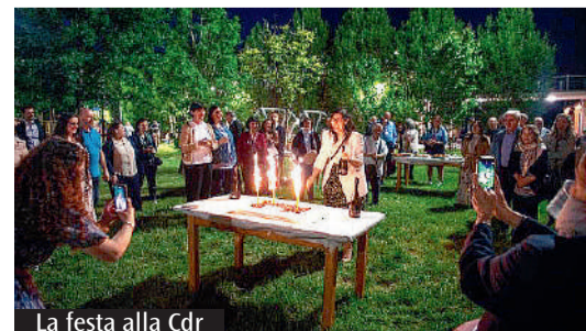
La festa alla Cdr

Con queste parole domenica 4 maggio, al termine della celebrazione eucaristica in Duomo nella quale ho ricevuto il dono della consacrazione in Cristo nell'Ordo Virginum, ho ringraziato e invitato tutti a fare festa insieme per quanto appena vissuto. Un vero dono di grazia accolto, un momento di paradiso condiviso con fratelli e sorelle che hanno intrecciato e reso magnifica la mia storia: tantissimi sacerdoti, consacrati e consacrate, amici, parenti e persone delle comunità di cui ho fatto e faccio parte, sono stati al mio fianco