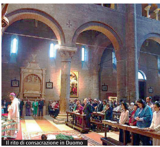
Il rito di consacrazione in Duomo