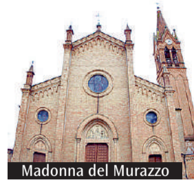
Madonna del Murazzo