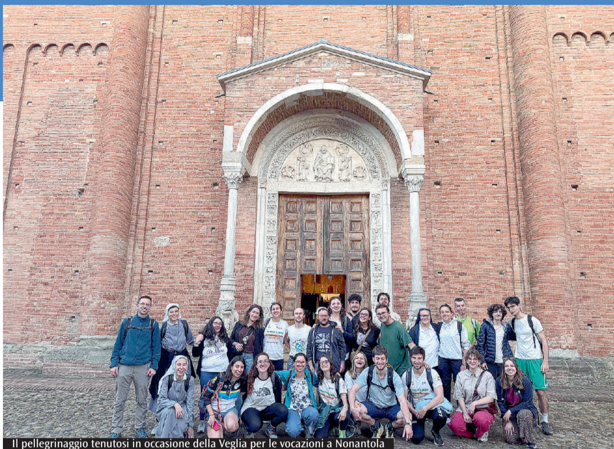
Il pellegrinaggio tenutosi in occasione della Veglia per le vocazioni a Nonantola

Con Maria, nella preghiera del Rosario, i partecipanti sono arrivati a Nonantola, davanti alla Basilica abbazia-