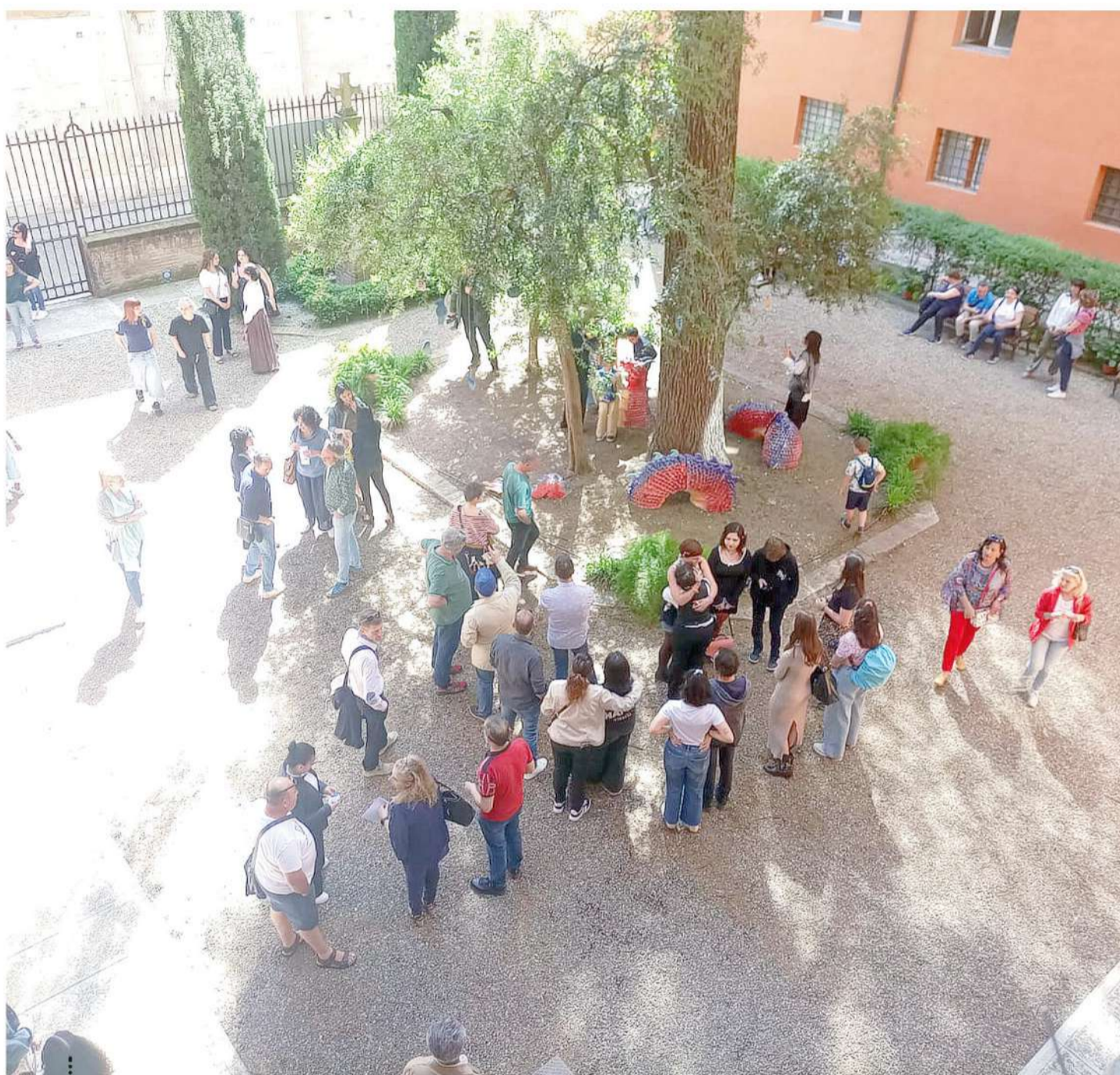
Studenti del Venturi e altri partecipanti riuniti nel cortile dei Musei del Duomo dove è stato riprodotto un Albero Peridexion con 200 volatili appesi circondato da un drago