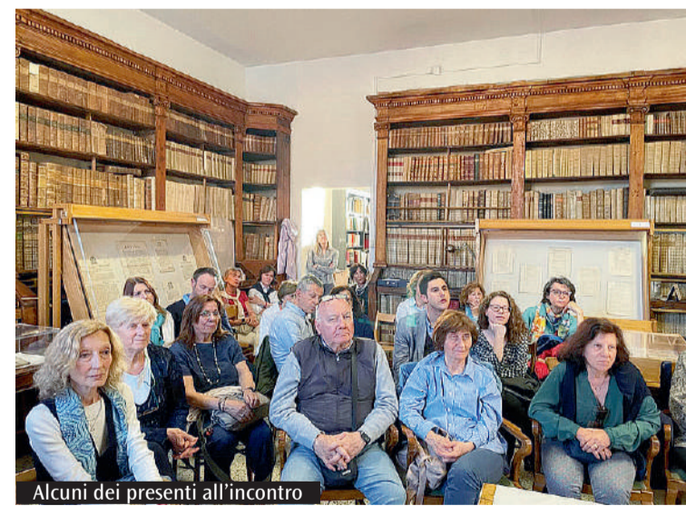
Alcuni dei presenti all'incontro