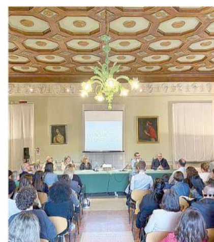
L'inaugurazione della mostra nella Sala Verde del Palazzo abbaziale di Nonantola con rappresentanti della scuola e dell'Ufficio Beni culturali

Era nato come un progetto per due classi nell'ambito del Pcto, ma alla fine hanno aderito 150 alunni accompagnati dai loro docenti di riferimento. La mostra "Luoghi di speranza - Dal medioevo al contemporaneo, arte per il Giubileo" è il risultato di un percorso di riflessione durato oltre sei mesi, nei quali i ragazzi hanno cercato di tradurre la virtù teologale con il loro stile. Tant'è che gli stessi giovani hanno creato un depliant e un sito con il quale documentare i lavori realizzati. La mostra è stata inaugurata sabato 10 maggio gli eventi sono proseguiti anche sabato 17, nel Museo Benedettino e diocesano d'arte sacra, e domenica 18 nei Musei del Duomo. L'iniziativa rientra nell'ambito di un più ampio progetto promosso dall'Ufficio diocesano beni culturali ecclesiastici in collaborazione con l'Istituto di istruzione superiore "Adolfo Venturi" e finanziato con il contributo della Fondazione di Modena e i fondi 8xmille.