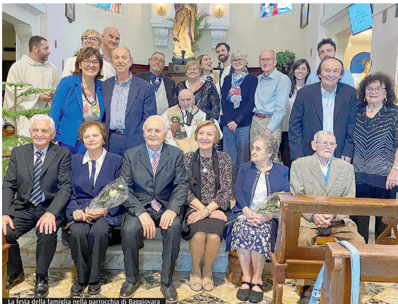
La festa della famiglia nella parrocchia di Baggiovara

A tale proposito, organizzare e vivere questa Festa in parrocchia significa anche educare alla fraternità e alla solidarietà. L'evento è stato stato infatti articolato in momenti di preghiera comunitaria, testimonianza di una giovane coppia missionaria, solenne celebrazione eucaristica, gesti