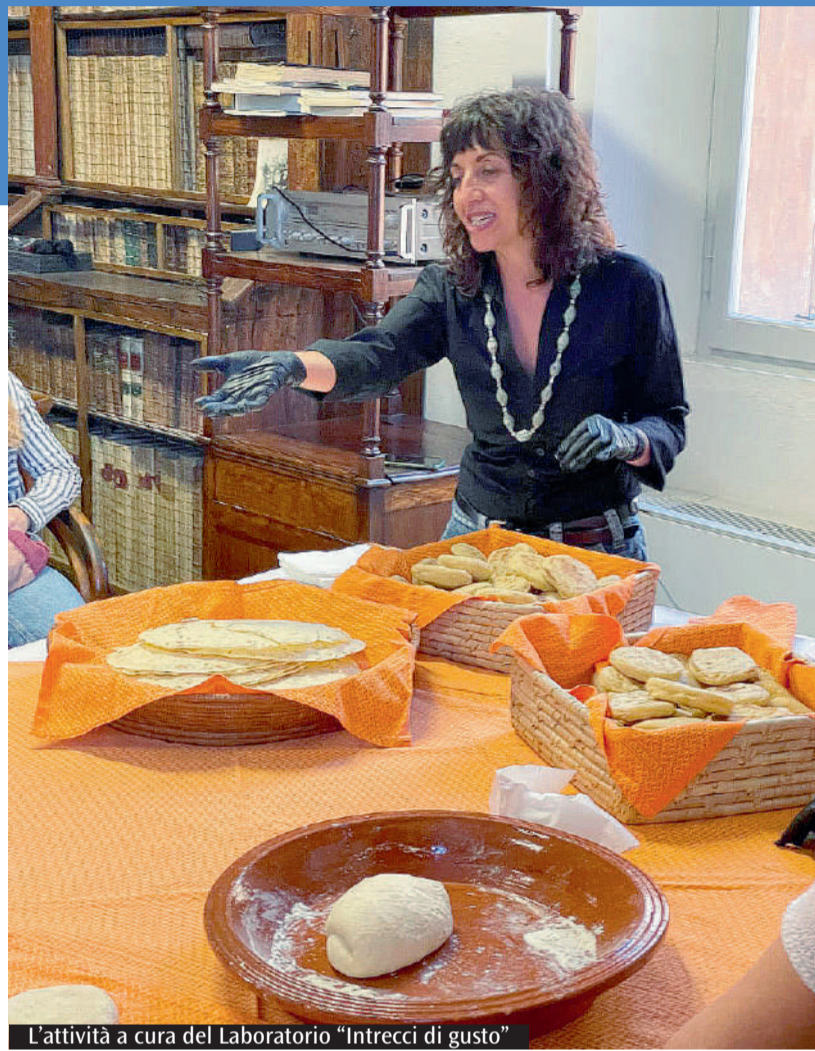
L'attività a cura del Laboratorio "Intrecci di gusto"

«C'era tanta gente» hanno riferito i promotori dell'attività. Esposti documenti sulle provviste di alimenti per la mensa del vescovo e per i canonici del Duomo. Illustrate anche le tradizioni che legano il Mediterraneo