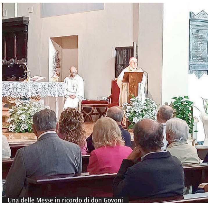
Una delle Messe in ricordo di don Govoni