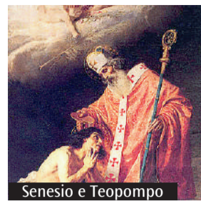
Senesio e Teopompo

Nonantola si è celebrata la memoria dei Santi Senesio e Teopompo, le cui reliquie sono custodite nella Basilica abbaziale di San Silvestro. Le celebrazioni hanno preso il via martedì 20 maggio con l'Ufficio delle letture e l'illustrazione della vita dei due santi martiri. Il giorno dopo, mercoledì 21 maggio, le celebrazioni sono iniziate dalle 9 del mattino con la Messa seguita dalle confessioni. Al pomeriggio, alle 16, si è tenuto il pellegrinaggio giubilare guidato all'interno della Basilica dopo il quale i partecipanti hanno ricevuto la bene-