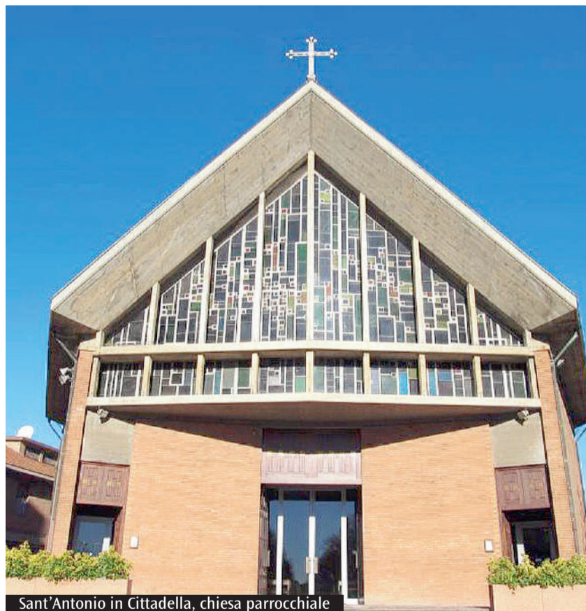
Sant'Antonio in Cittadella, chiesa parrocchiale

Due percorsi per approfondire la propria fede e la relazione con Dio