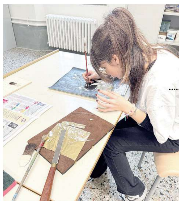
Giovane, fra i protagonisti del progetto, realizza una tra le opere esposte ai Musei del Duomo e in quello Benedettino d'Arte Sacra. Ogni loro creazione cerca di tradurre la speranza