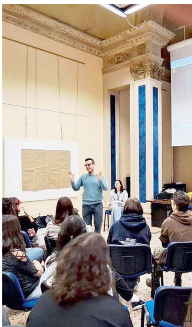
Momento laboratoriale guidato dall'Ufficio diocesano beni culturali ecclesiastici. Gli artisti hanno svolto un percorso preparatorio di sei mesi