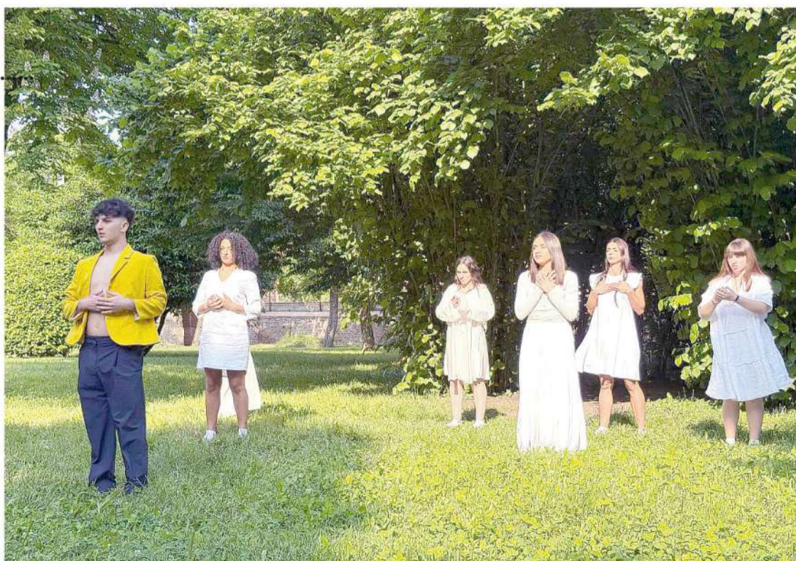
Performance artistica interpretata lo scorso 10 maggio nei Giardini abbaziali di Nonantola da sette studentesse e uno studente del percorso professionale