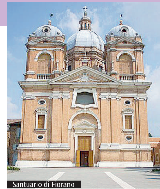
Santuario di Fiorano

Alle 9 a Eparchia di Lungro: divina liturgia Alle 18 a Isola Vicentina: incontro sul Sinodo