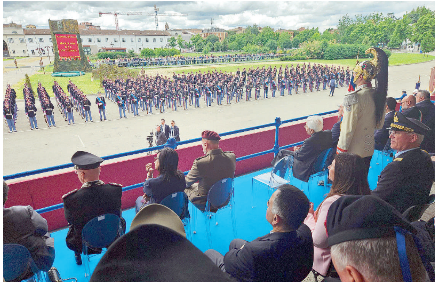
Cerimonia Mak \pi 100 tenutasi la mattina di venerdì 23 maggio al Parco Novi Sad. Presenti alcune autorità tra cui il capo dello Stato, il ministro della Difesa e l'arcivescovo.

Una folla di famiglie, autorità e cittadini ha accolto con calore la cerimonia del Mak \pi 100 svoltasi venerdì 23 maggio al Parco Novi Sad, cuore verde della città, per celebrare i cento giorni che separano gli allievi ufficiali del 205° corso "Fierezza" dell'Accademia militare dalla conclusione del biennio di studi. Un evento carico di emozione, tradizione e significato, suggellato dalla presenza del presidente della Repubblica Sergio Mattarella, accolto con sentito applauso, e del ministro della Difesa Guido Crosetto, che ha rivolto ai giovani un discorso denso di valori e visione. Il Mak \pi 100 - derivato dall'antica esclamazione piemontese «Mach pi tre ani!» e successivamente adattato in «Mach pi cent!» per indicare "ne mancano cento" - è oggi molto più di una ricorrenza simbolica: è un passaggio di testimone, una tappa identitaria, un momento di orgoglio collettivo per chi si prepara a diventare ufficiale delle Forze armate italiane. «Siate sempre di esempio per tutti: i vostri futuri soldati, le vostre famiglie, il vostro Paese», ha affermato Crosetto, ricordando agli allievi che «comandare non significa esercitare il potere, ma indicare la strada». Un invito a vivere la leadership come responsabilità etica prima che gerarchica, in un tempo che richiede fermezza di valori oltre che compe-