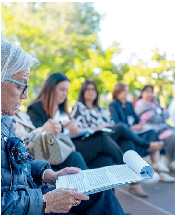
La tavola rotonda di venerdì 23 maggio

«Qui uniamo i valori di sempre con le sfide attuali»