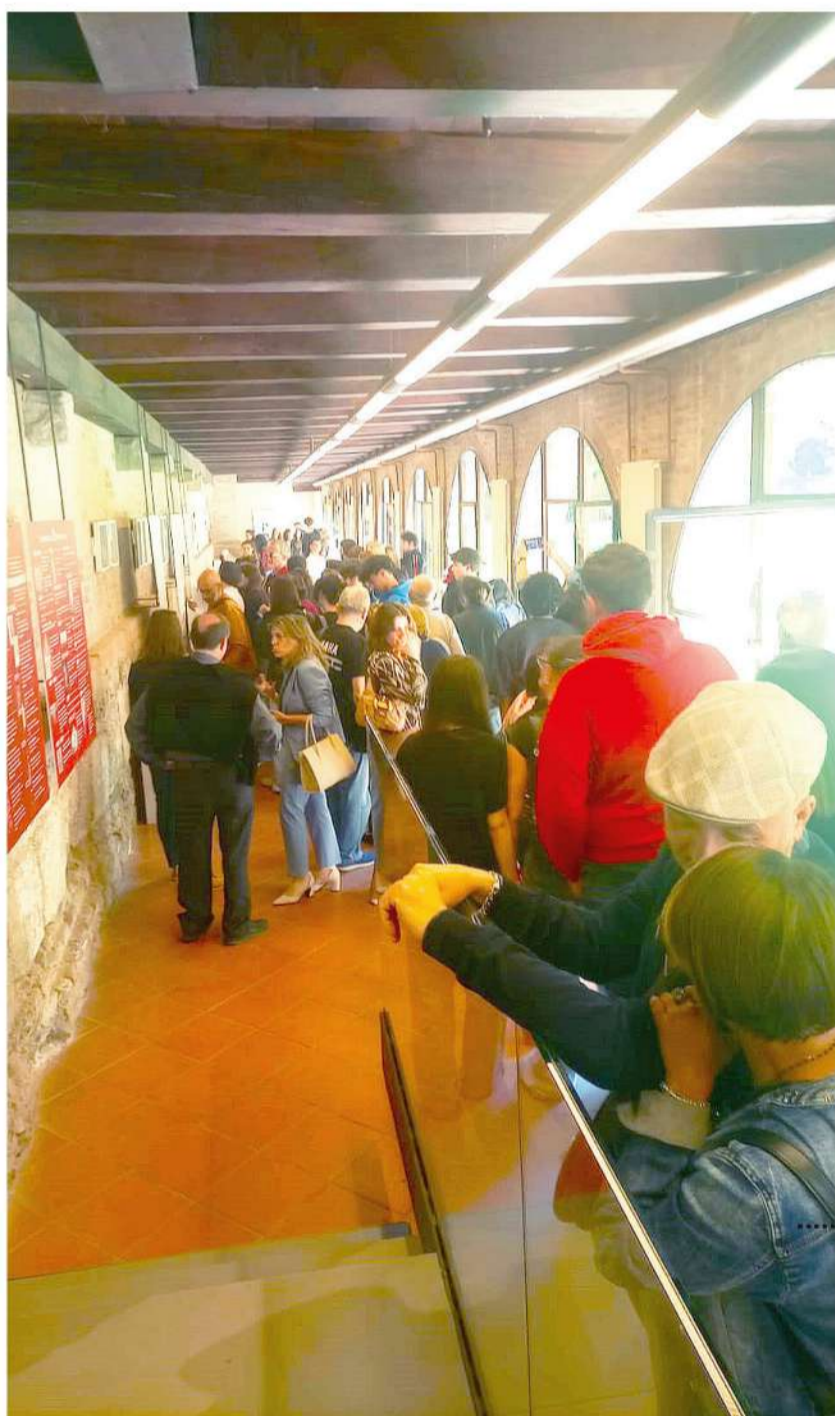
Itinerario aperto al pubblico tra le opere esposte all'interno del Museo diocesano e benedettino d'Arte Sacra