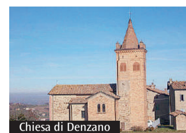
Chiesa di Denzano

Questa mattina la Messa all'oratorio di San Gaetano seguita dalla processione verso la chiesa. Seguirà la celebrazione eucaristica cantata