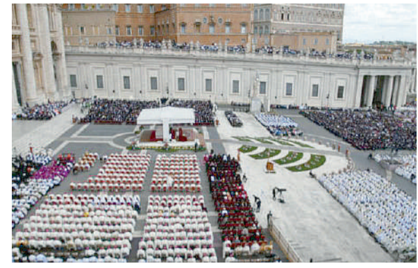
La Messa di inizio pontificato di Leone XIV sul sagrato della Basilica di San Pietro alla presenza di 150mila persone, tra cui leader religiosi e delegazioni diplomatiche