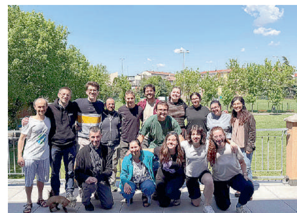
Partecipanti sacerdoti ed educatori alla settimana comunitaria vocazionale che si è svolta dall'11 al 17 maggio presso la Cdr

chiama una prima volta ma poi non ci abbandona: continua a cercare e coltivare la relazione con noi. Anche le coppie di sposi che hanno condiviso con noi la loro storia hanno parlato di quanto sia fondamentale continuare a coltivare il rapporto con il Signore e con il coniuge, di come ogni tanto serva fermarsi davanti al Lui e fare memoria, per non dimenticare e soprattutto per ringraziare per tutto ciò che è stato donato fin ora. Ecco che la lettera ai Corinzi ha aiutato i presenti a comprendere cosa significa vivere la vocazione nella Chiesa. San Paolo dice «è forse diviso Cristo?». Ci spiega come i doni provengono dallo Spirito e sono dati a ciascuno in modo diverso, sono