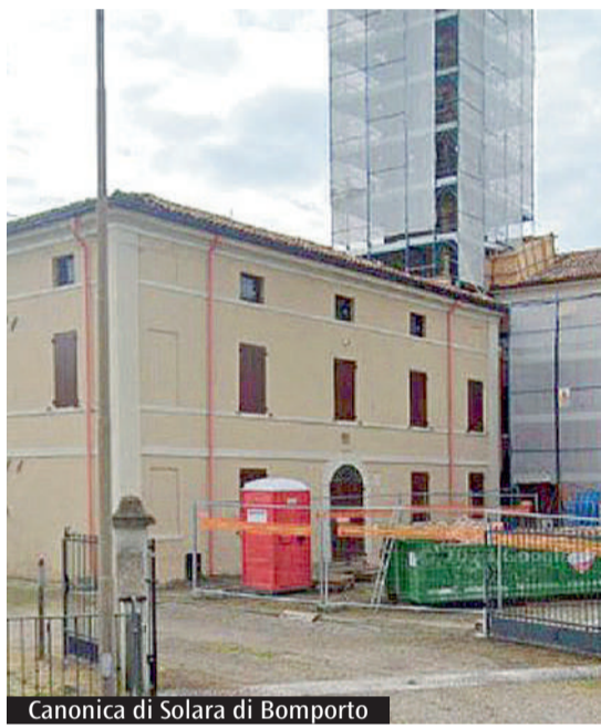
Canonica di Solara di Bomporto

Tra i progetti realizzati nell'ambito della piattaforma Mude: 16 sono conclusi, 11 in corso di esecuzione e 6 in fase di avvio. L'ingegner Benatti commenta lo stato dei lavori