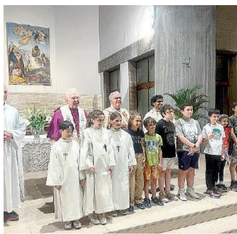
In alto i celebranti con i bambini che quest'anno hanno ricevuto la prima Comunione. A destra statua della Vergine