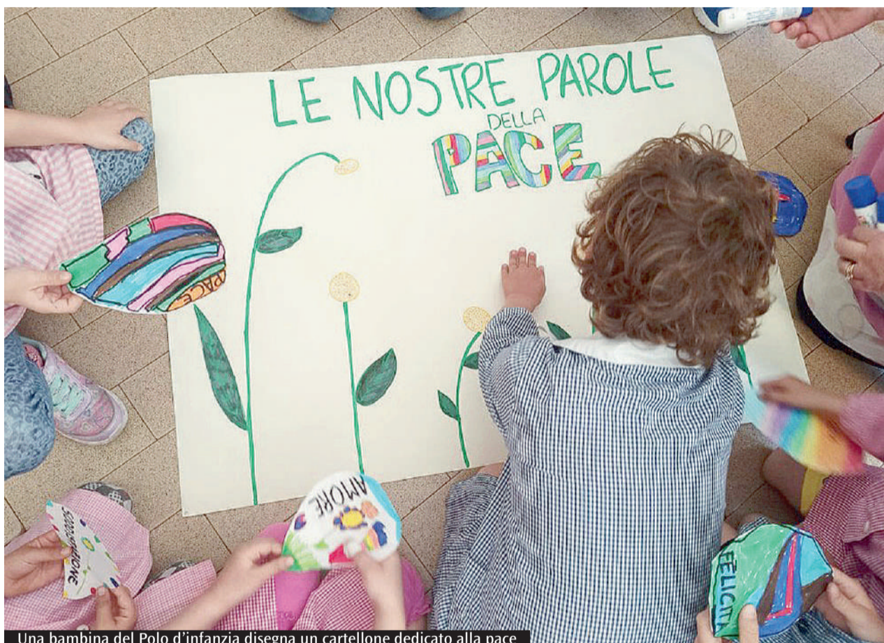
Una bambina del Polo d'infanzia disegna un cartellone dedicato alla pace

Tra i momenti più significativi, la suggestiva «Caccia ai colori» - ispirata al libro illustrato «Boom! La guerra dei colori» - ha trasformato il giardino del Polo in uno spazio di ricerca attiva: piccoli straccetti colorati, provenienti dalla sartoria circolare e circondariale «Manigolde», disseminati tra gli