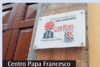
Centro Papa Francesco

Venerdì prossimo, 13 giugno, il Centro Papa Francesco aprirà le sue porte alla comunità. L'«Open day» inizierà alle 17.30 nella chiesa di San Bartolomeo, dove l'arcivescovo Erio Castellucci terrà una riflessione sull'importanza dell'accoglienza nella comunità cristiana e, in particolare, sulla progettualità avviata dal 2018 nei