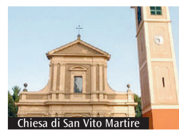
Chiesa di San Vito Martire

Le iniziative per i 200 anni di ricostituzione della parrocchia La celebrazione con l'arcivescovo Erio Castellucci