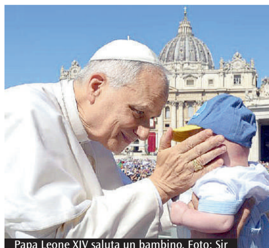
Papa Leone XIV saluta un bambino.

esempio, ogni volta che s'invoca la libertà non per donare la vita, bensì per toglierla, non per soccorrere, ma per offendere. Tuttavia, anche davanti al male, che contrappone e uccide, Gesù continua a pregare il Padre per noi, e la sua preghiera agisce come un balsamo sulle nostre ferite, diventando per tutti annuncio di perdono e di riconciliazione». Il Santo Padre ha citato sant'Agostino per ribadire che «un giorno tutti saremo uno». «Non solo noi - ha concluso -, ma anche