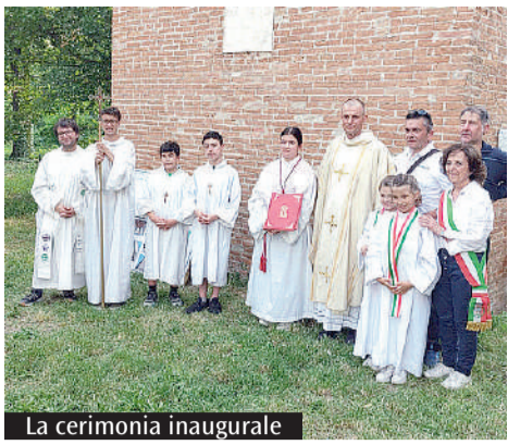
La cerimonia inaugurale