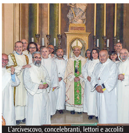
L'arcivescovo, concelebranti, lettori e accoliti

Quest'anno la celebrazione del Corpus Domini cittadino si terrà nella chiesa parrocchiale di Gesù Redentore, in via Leonardo Da Vinci 270. L'appuntamento è previsto per giovedì 19 giugno, alle 20.30, con la Messa presieduta dall'arcivescovo Erio Castellucci e concelebrata dal Clero diocesano. La celebrazione del Corpus Domini, ovvero del Santissimo Corpo e Sanguine di Cristo, è una festa di precetto che chiude il ciclo del periodo post-Pasqua e celebra il mistero dell'Eucaristia istituita da Gesù nell'ultima cena. L'origine della festa risale alle rivelazioni della beata Giuliana di Retine, priora del monastero di Monte Cornelio con sede a Liegi, in Belgio, che nel 1208 ebbe una visione: si trattava del disco lunare risplendente di luce, con un lato rimasto in ombra. La visione fu interpretata come immagine della Chiesa del tempo, ancora carente di una festa dedicata al Santissimo Sacramento. Così la solennità è stata istituita nel 1246, il giovedì dopo l'Ottava della Trinità.