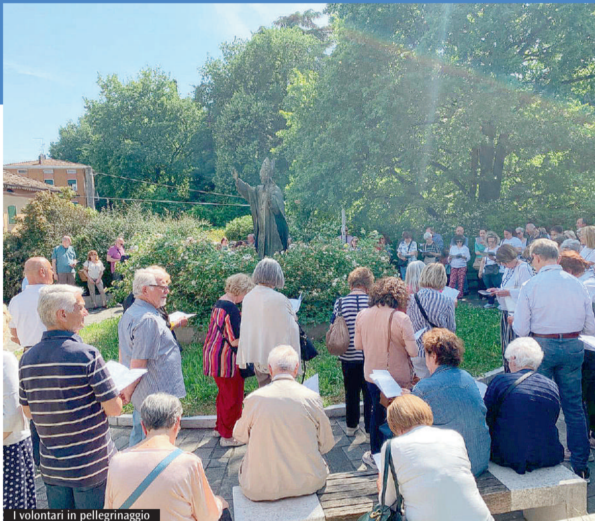
I volontari in pellegrinaggio

aspettarsi a vicenda. Cosa unisce? La meta. È la sostanza della nostra Fede. Maria si alzò, uscì di casa: ecco il nostro grande passo, uscire dalle nostre comode case dove stiamo troppo bene. Il motivo più valido per uscire è farsi prossimo per essere di aiuto a qualcuno, per condividere con qualcuno che ha bisogno, per tirare fuori una solitudine. Maria va a trovare la cugina ed entrambe si sono "raccontate". Tale condivisione avviene quando il cuore è pieno. Don Andrea ha concluso dicendo che il Signore compie grandi cose nella comunità e che noi possiamo farci annunciatori di questo dono.