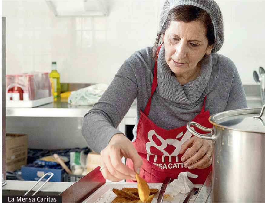
La Mensa Caritas

ta del regime comunista di Ceausescu. Il ricordo della moglie lo commuove e lo intristisce. Si rigano gli occhi di lacrime. Occhi feriti, eppure sereni. Mi racconta la sua storia: il lavoro, gli investimenti sbagliati, la frustrazione per non aver potuto avere figli, le fatiche famigliari, gli incidenti di percorso. Sul viso s'intravedono le ferite di una vita e la lotta. Lo ascolto. Mi confida che tutte le settimane legge il mio commento al Vangelo sul foglio parrocchiale. Lo ritaglia e lo passa ad un suo vicino di casa. Mi racconta che dopo aver co-