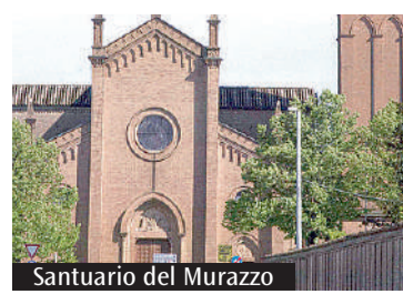
Santuario del Murazzo

Quest'anno la scelta è ricaduta sulla chiesa dedicata alla Vergine. L'esperienza in un'oasi di preghiera e la devozione rinnovata dei partecipanti