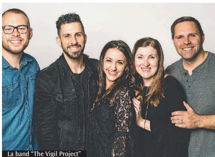
La band "The Vigil Project"

Il mattino seguente i pellegrini hanno proseguito il loro itinerario verso Roma per vivere la veglia di Pentecoste in Santa Cecilia e coronare il pellegrinaggio giubilare, esprimendo un senso di gratitudine profonda per l'accoglienza ricevuta dalle famiglie, da tutta la comunità e dai sacerdoti.