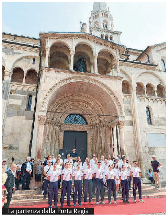
La partenza dalla Porta Regia

Oggi alcuni atleti modenesi e migliaia di sportivi provenienti da più Paesi incontreranno papa Leone XIV. Gli atleti hanno raggiunto Roma a seguito della staffetta, partita mercoledì 11 giugno dalla Porta Regia del Duomo, in occasione del Giubileo degli sportivi. I primi a portare il testimone, una chiave in legno e metalli con la rappresentazione di San Geminiano, sono stati i cadetti e le cadette dell'Accademia militare. Altri atleti, in rappresentanza di tutto il mondo sportivo modenese, daranno loro il cambio lungo il percorso. L'iniziativa è organizzata da Rock No War e Un Ponte verso Betlemme e prevede anche una raccolta fondi a favore dei bambini palestinesi. «Corre la speranza»: è il messaggio bellissimo che un gruppo di amici modenesi porterà, letteralmente, attraverso le proprie gambe, a Roma per il Giubileo degli Sportivi insieme a papa Leone XIV, sportivo lui stesso, sono state le parole rivolte dall'arcivescovo Erio Castellucci ai 42 atleti che si sono