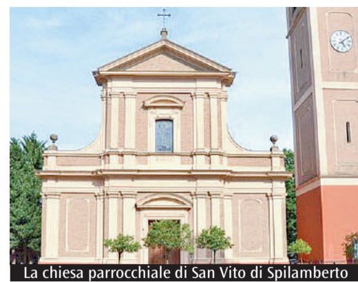
La chiesa parrocchiale di San Vito di Spilamberto