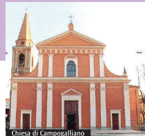
Chiesa di Campogalliano

Da venerdì 20 a lunedì 30 giugno Viaggio in Brasile