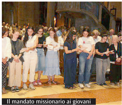
Il mandato missionario ai giovani

La Veglia di preghiera in Cattedrale con il Centro missionario diocesano. La riflessione dell'arcivescovo e le parole di don Baraldi, già in servizio in Canada