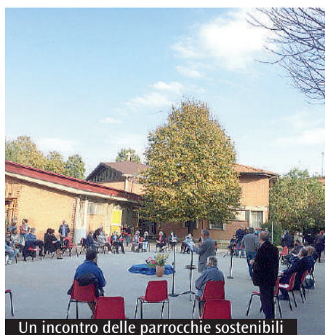
Un incontro delle parrocchie sostenibili

pegni di cura del Creato rimane un punto critico. Solo il 27% delle parrocchie comunica regolarmente le proprie iniziative, prevalentemente attraverso bacheca (30%), giornale parrocchiale (22%), sito web e chat parrocchiale (19%). Il 44% richiede esempi di buone pratiche, supporto tecnico di esperti e documenti di approfondimento. Alcuni spunti sono presenti sul sito chiesamodena-nonantola.it. Le tematiche prioritarie per il futuro includono attività per cura del creato e l'ecologia integrale (36%), le comunità energetiche e l'energia rinnovabile (29%), la finanza etica (14%). Le parrocchie accolgono quindi la Laudato si', ma nello stesso tempo esigono ulteriore formazione sui percorsi da intraprendere.