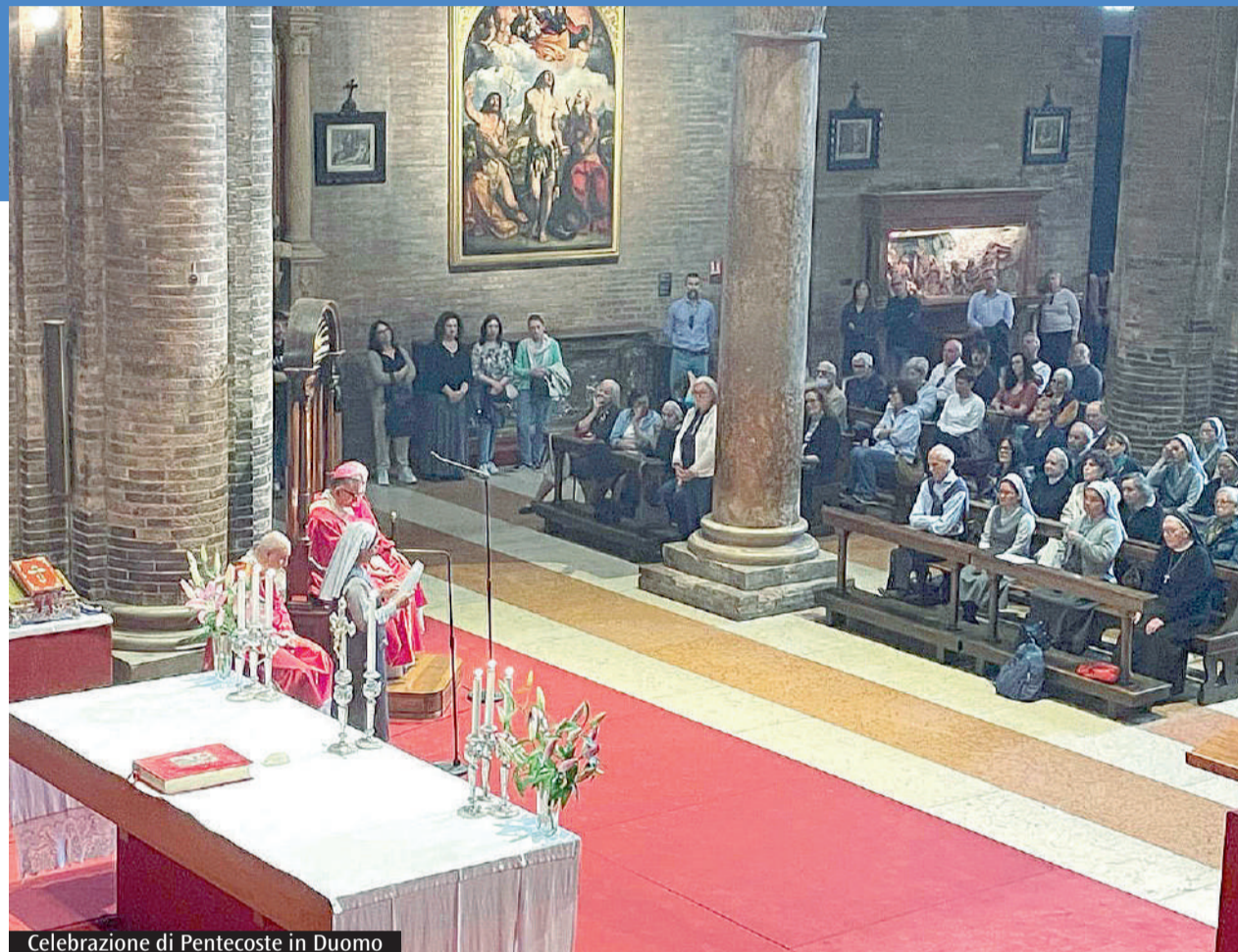
Celebrazione di Pentecoste in Duomo