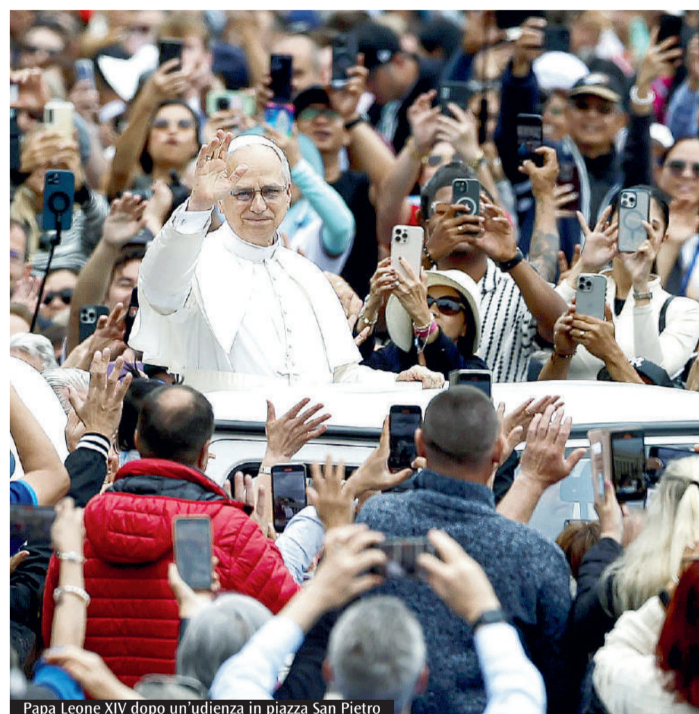
Papa Leone XIV dopo un'udienza in piazza San Pietro

Bibbia venga conosciuto e messo in pratica in modo fondamentalista. La Scrittura e la più ampia tradizione vanno interpretate, nel senso che vanno capite a partire dall'orizzonte culturale e teologico nel quale sono state prodotte, e il loro messaggio va poi ulteriormente esplicitato alla luce delle domande antropologiche e delle istanze sociali del momento presente. È in questo modo che si coglie la volontà del Signore sulla sua Chiesa. Il compito di cogliere la parola di Dio attraverso questa interpretazione delle fonti che la attestano appartiene a tutto il popolo di Dio. Tuttavia, sin dalle origini le comunità cristiane hanno avuto bisogno di figure autorevoli, titolari del carisma apostolico o di quello della sua successione, che garantissero che tale processo ermeneutico non subisse derive fuorvianti. Oggi questo carisma è conferito nella Chiesa esclusivamente con il sacramento dell'Ordine, per cui quest'ultimo