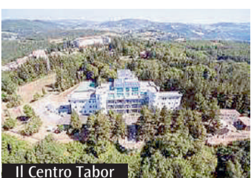
Il Centro Tabor

Dal 10 al 13 luglio si terrà la seconda edizione al Centro Tabor. Il programma a partire dal Vangelo di Matteo. L'evento "Il Vangelo in piazza"