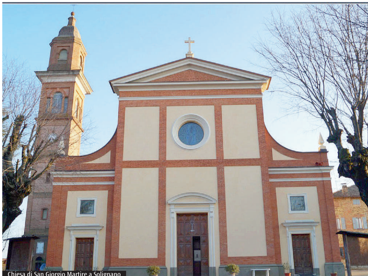
Chiesa di San Giorgio Martire a Solignano

Ufficio diocesano beni culturali ecclesiastici