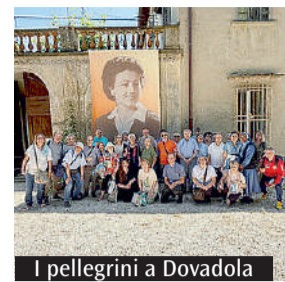
I pellegrini a Dovadola