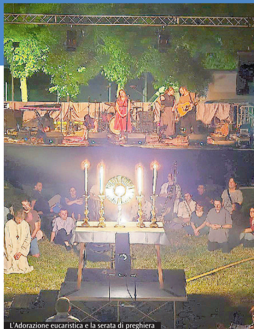
L'Adorazione eucaristica e la serata di preghiera

Le giornate di formazione alternate tra "talk" mattutini e workshop pomeridiani. Gli artisti invitati a riscoprire la contemplazione in un ambiente accogliente. Oltre cinquecento partecipanti alla serata di preghiera