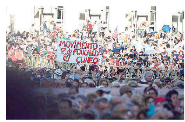
Alcuni tra i presenti alla Messa presieduta da papa Leone XIV domenica 8 giugno, in piazza San Pietro, in occasione del Giubileo dei movimenti