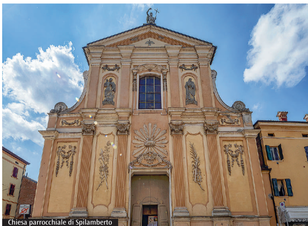
Chiesa parrocchiale di Spilamberto

Da un piccolo gesto di condivisione possono nascere altri piccoli gesti, anzi, una catena di gesti e la comunità cristiana si ritrova a vivere non da "separata", ma da "mescolata", quindi immersa nel mondo con tutti coloro che vivono la stessa realtà nello stesso Paese.