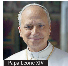
Papa Leone XIV

Quest'anno la Giornata per la carità del Papa si celebra domenica 29 giugno, solennità dei Santi Pietro e Paolo, in tutte le parrocchie. La Giornata ha l'obiettivo di promuovere l'obolo di San Pietro, «un'offerta che può essere di piccola entità, ma è di grande valore simbolico», che «manifesta il senso di appartenenza alla Chiesa e amore e fiducia per il Santo Padre». Sul sito obolodisanipto.va, si legge che tale offerta è «un segno concreto di comunione con Lui,