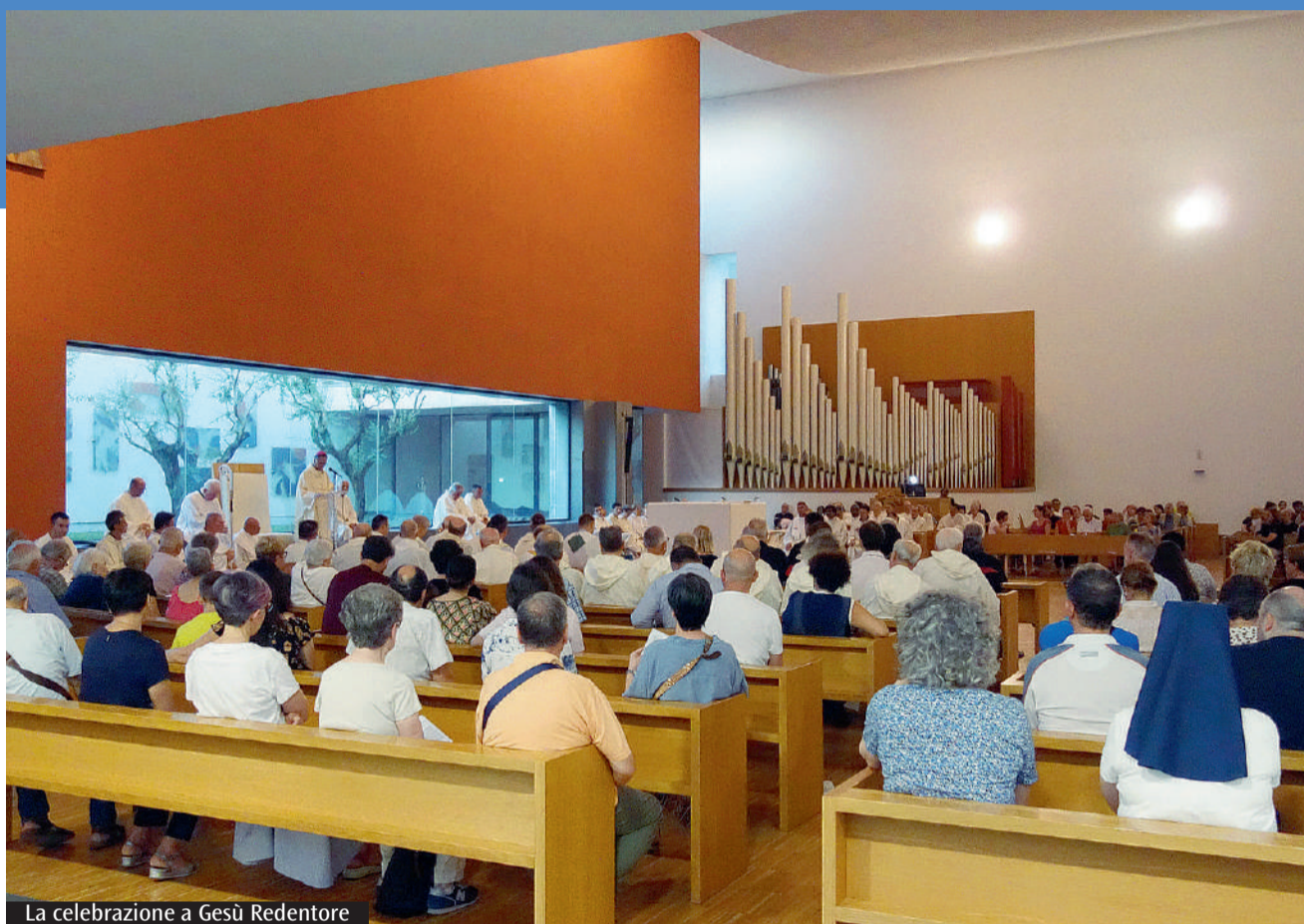
La celebrazione a Gesù Redentore

In realtà la proposta di Gesù è molto semplice. Con i cinque pani e i due pesci è possibile sfamare tutti, a patto che si abbia il coraggio di offrirli e dividerli. Ai discepoli Gesù non chiede le cose impossibili che avevano immaginato, ma chiede solo di sistemare la folla in modo ordinato e distribuire poi il cibo, una volta pronunciata la benedizione. La soluzione di Gesù, è certo un miracolo, che non avrebbe potuto prevedere nessuno, ma è un miracolo che accade ogni giorno, quando qualcuno ha il coraggio della