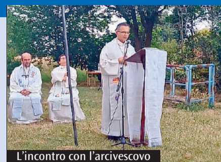
L'incontro con l'arcivescovo

«La carità è paziente, è benigna la carità; non è invidiosa la carità, non si vanta, non si gonfia, non manca di rispetto, non cerca il suo interesse, non si adira, non tiene conto del male ricevuto, non gode dell'ingiustizia, ma si compiace della verità». Così dice san Paolo nella prima Lettera ai Corinzi, capitolo 13, e così si è vissuta, sabato scorso, la visita dell'arcivescovo presso la Casa della Carità di Cognento. Tutto è svolto nella massima semplicità, con un momento di convivialità dove gli ospiti della casa e i loro angeli custodi hanno condiviso un buffet e tanta allegria. È seguita la Messa allestita sull'aria, a cielo aperto dove, una volta, ha ricordato l'arcivescovo, la famiglia trascorreva tanto del suo tempo. Ed è