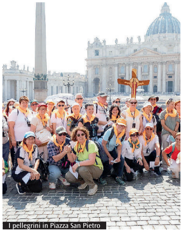
I pellegrini in Piazza San Pietro