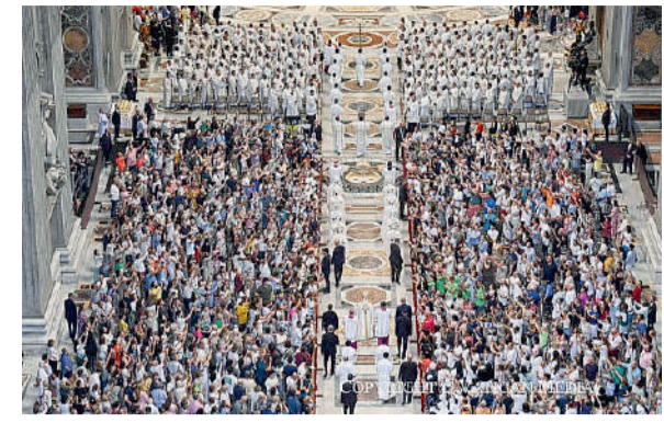
La Messa celebrata da papa Leone XIV nella Basilica di San Pietro il 15 giugno, solennità della Santissima Trinità, Giubileo dello Sport.