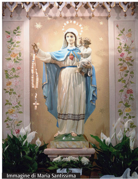
Immagine di Maria Santissima

Come ogni anno la comunità de "La Grande" di Nonantola organizza la sagra dedicata al Cuore immacolato di Maria Santissima, che inizierà oggi, alle 9, con la Messa. Domani, 1° settembre, nel parcheggio in via di Mezzo, prenderà il via la preghiera del Rosario, che si terrà ogni sera, alle 20.30, fino a venerdì 5, in un punto diverso della frazione. Martedì 2 settembre il Rosario si terrà nel parcheggio di fronte alla Cafetteria, mercoledì 3 nel Quartiere Sacchetti, nel parco il Quadrato (angolo area giochi) e giovedì 4 settembre in via Solferino, rientranza casa Reggiani - Calciolari. Nei giorni successivi la preghiera del Rosario si terrà in chiesa: venerdì 5 settembre, alle 20.30, con una meditazione guidata da don Graziano Gavioli, parroco di San Giovanni Evangelista, e sabato 6 settembre