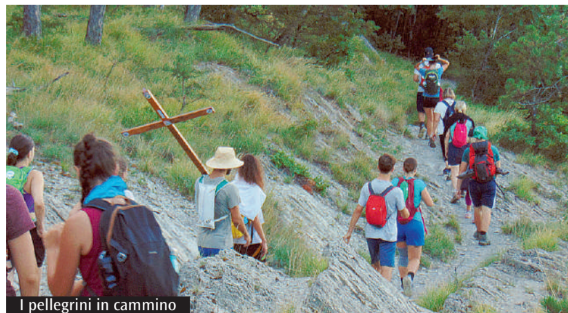
I pellegrini in cammino

L'esperienza: «Nel gruppo abbiamo ritrovato la forza per andare avanti nei momenti di fatica e difficoltà»