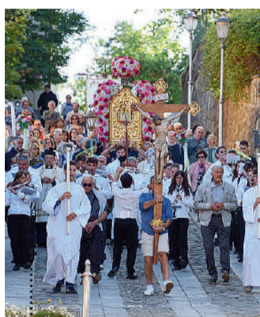
La solennità della Madonna della Neve a Montese. La processione.