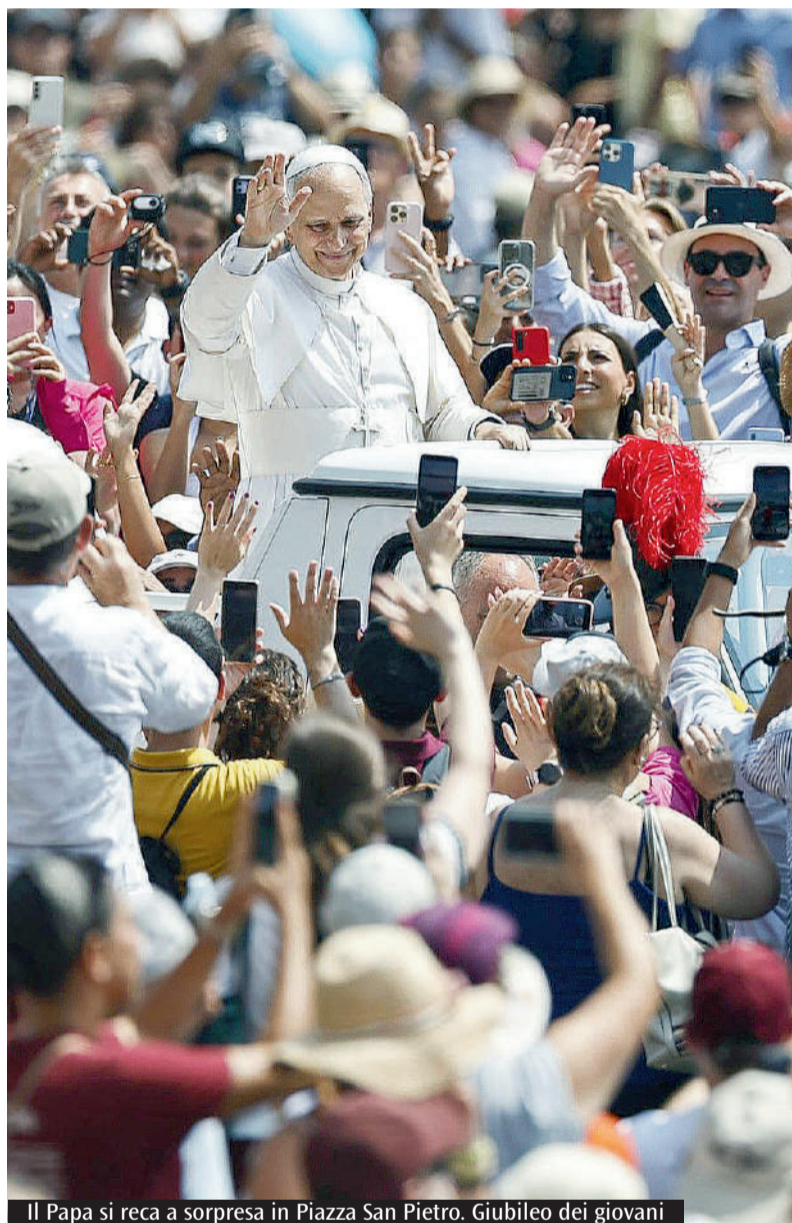
Il Papa si reca a sorpresa in Piazza San Pietro. Giubileo dei giovani