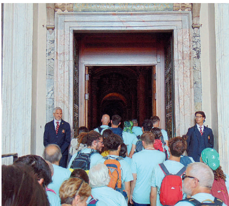
A sinistra il momento in cui i pellegrini varcano la Porta Santa della Basilica di San Pietro, raggiunta dopo tre settimane di cammino e preghiera. A sinistra, uno scatto del percorso fatto a piedi, portando la croce, in una giornata soleggiata

Il pellegrinaggio giubilare dei fedeli di Corlo e Magreta: percorsi centinaia di chilometri a piedi, affrontando caldo e qualche temporale