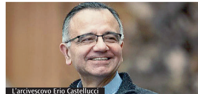
L'arcivescovo Erio Castellucci

Domani, in occasione della 20ª Giornata per la Custodia del Creato, l'arcivescovo Erio Castellucci parteciperà all'incontro "Per una casa comune più accogliente e fraterna". L'appuntamento si terrà presso la Sala dei Contrari della Rocca di Vignola (ingresso da via Ponte Muratori) alle 20.30 e vedrà anche l'intervento del cantautore Luca Frigeri, che proporrà alcuni brani tratti dalla sua opera "Connessione spirituale". L'iniziativa è promossa dal Convento dei cappuccini di Vignola e dal Santuario della Beata Vergine della Salute di Puianello nell'ambito dell'ottavo centenario del Cantico delle creature di san Francesco.