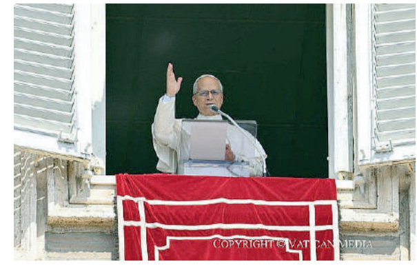
Il Pontefice Leone XIV presiede la preghiera dell'Angelus di domenica 24 agosto dalla finestra del Palazzo apostolico, alla presenza di migliaia di fedeli