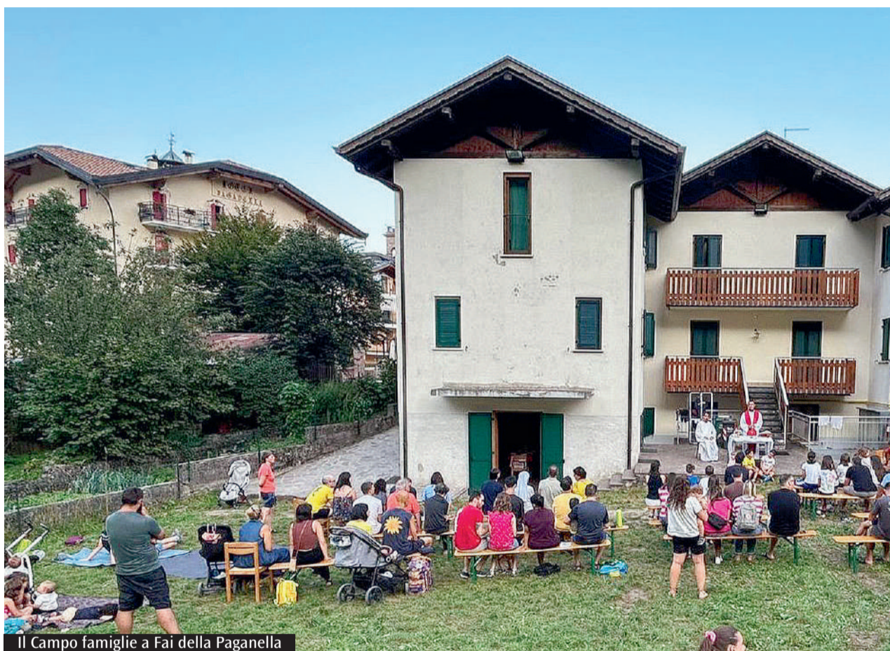
Il Campo famiglie a Fai della Paganella