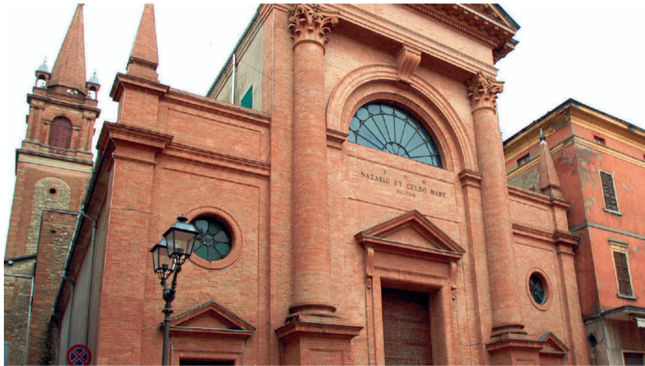
La chiesa parrocchiale dei Santi Nazario e Celso a Vignola ospiterà alcune delle celebrazioni eucaristiche previste durante la trazionale sagra di San Luigi, che si terrà da sabato 6 a domenica 14 settembre