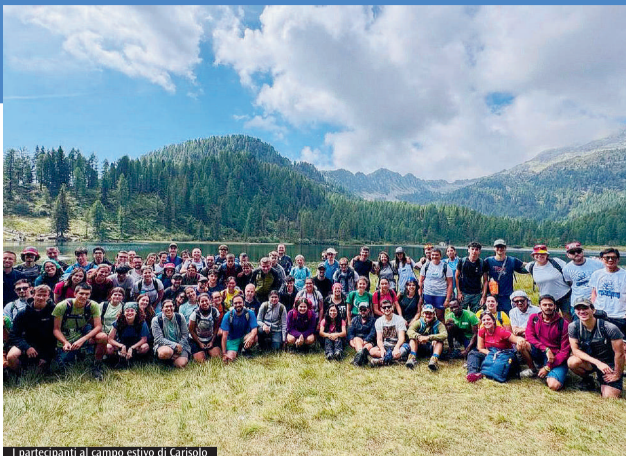
I partecipanti al campo estivo di Carisolo

Novanta ragazzi hanno trascorso una settimana con monsignor Castellucci La riflessione sulle relazioni