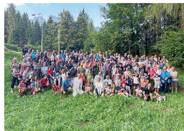
Partecipanti e sacerdoti presenti al campo famiglie della parrocchia di Formigine tenutosi a Falcade dal 9 al 16 agosto

Poi i giovani si sono riuniti per la discussione, in seguito alla visione di un film. In vari gruppi sono state preparate le domande da sottoporre all'arcivescovo Erio Castellucci, che lo scorso 13 agosto ha visitato il campo, sul tema della guerra e sull'economia che domina il mondo. Rispondendo alle domande l'arcivescovo ha sottolineato l'importanza di saperi ancora indignare di fronte alle ingiustizie, la difficoltà di accedere ad un'informazione attendibile, il valore di un impegno politico, non necessariamente partitico, dei cristiani e infine la centralità della preghiera e della testimonianza. È stata poi celebrata l'Eucaristia, nel verde di un bosco, comprendendo che solo in Cristo si può aspirare a un mondo più giusto. Al termine del campo i bambini