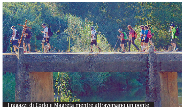
I ragazzi di Corlo e Magreta mentre attraversano un ponte

Eravamo una comunità in cammino, che trae forza dall'essere gruppo, costruendo legami significativi. Inoltre, macinare così tanti chilometri e passare molto tempo insieme ha donato nuove energie. La fatica, le paure e le preoccupazioni sono diventate fragilità comuni, che ci rendevano gruppo. Ci siamo svuotati e riempiti di nuova linfa e accanto a noi abbiamo sentito viva la presenza del Signore che tramite la Provvidenza ha aiutato a risolvere gli inconvenienti presentati di volta in volta. Di fronte alle prove di una quotidianità meno confortevole abbiamo imparato ad apprezzare le piccole cose che normalmente diamo per scontate: avere un