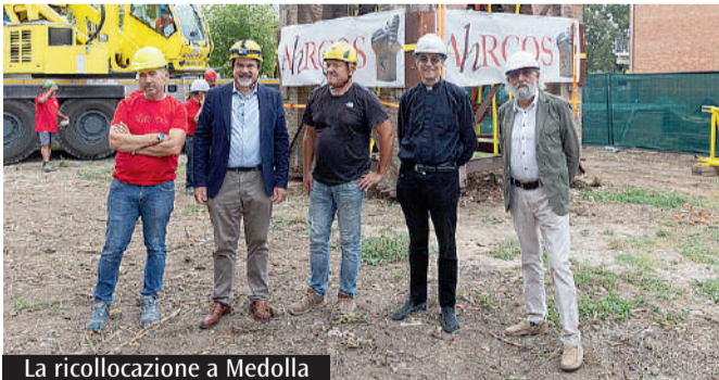
La ricollocazione a Medolla