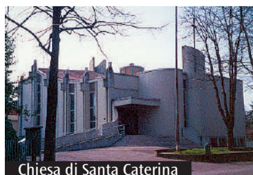
Chiesa di Santa Caterina

Domani pomeriggio presso la Casa della gioia: l'Unzione degli infermi e un momento conviviale. Nei prossimi giorni: Adorazione eucaristica, riflessione e festa