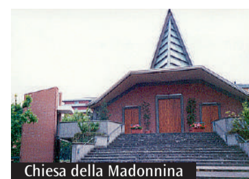
Chiesa della Madonnina

Partono oggi gli incontri nei cortili organizzati dalla parrocchia. Dal 12 al 14 la sagra