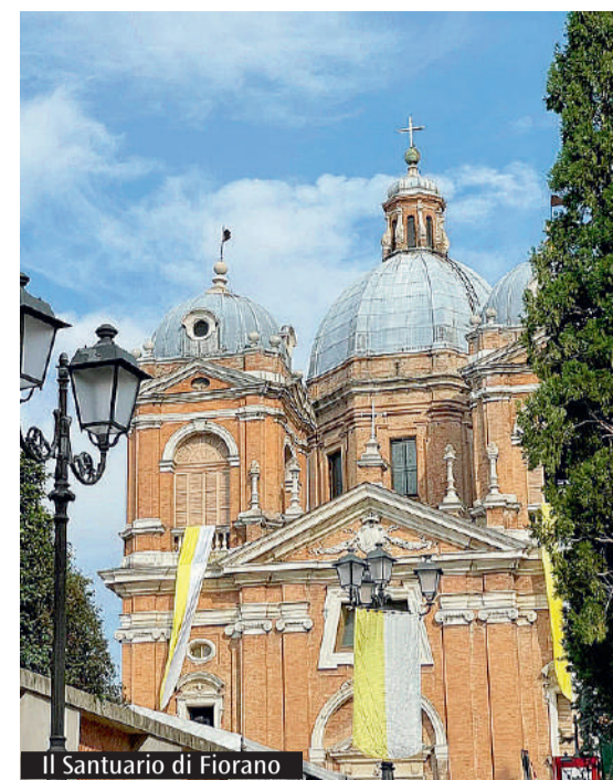
Il Santuario di Fiorano