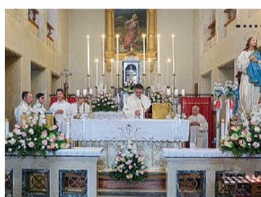
La festa parrocchiale a Iola in onore di Santa Maria Assunta. La celebrazione seguita dalla processione