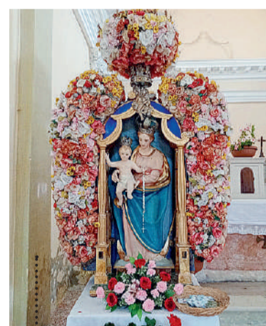
Statua della Vergine situata all'Oratorio dei Lazzari, parrocchia di Maserno.